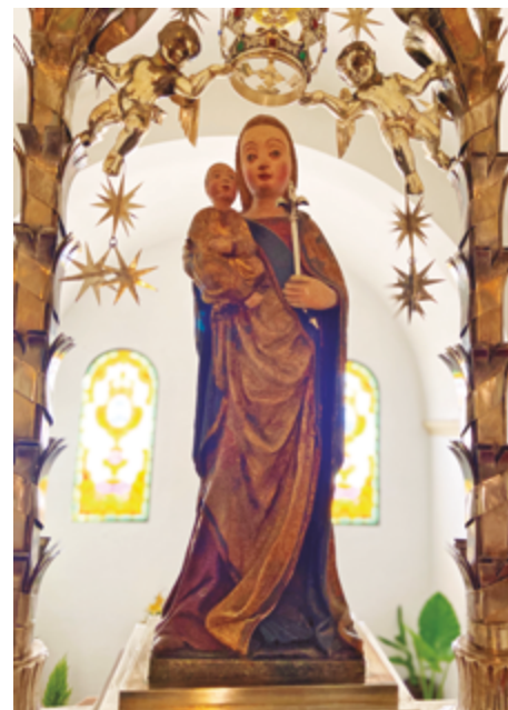
Imatge de la Maredeu del Miracle de Balaguer (s. XV)

La conversió de l'infidel acaba de justificar la presència i l'objectiu de la imatge a la ciutat i la construcció de la nova església al bell mig de la Jueria, possiblement