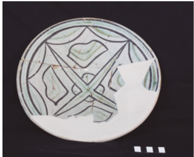
Plat tallador (segle XIV) recuperat a l'excavació de l'església de sant Josep l'any 2000, pertanyent a l'antiga Jueria.