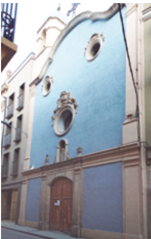
Façana de l'església de santa Maria del Miracle de Balaguer (s. XIX) a l'actualitat.

Hem vist ja com l'església del Miracle de Lleida fou efectivament l'església dels conversos d'aquella ciutat. Hem vist com molts conversos de Balaguer seguien habitant l'antiga Jueria a finals segle XV i inicis segle XVI dedicats al comerç i a la indústria i constituint, doncs, una classe social amb poder adquisitiu que justificaria la riquesa de la confraria. Hi hem d'afegir que el Miracle de Balaguer, per la seva ubicació, pel contingut de la seva llegenda i els costums que han pervis-