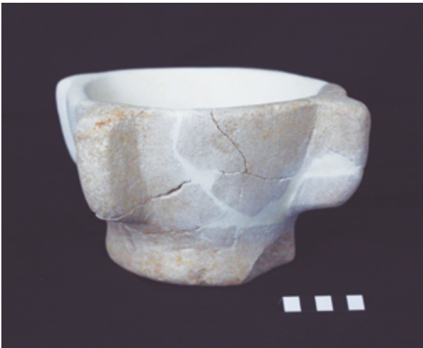
Morter de pedra (segle XIV) recuperat a l'excavació de l'església de sant Josep l'any 2000, pertanyent a l'antiga Jueria.