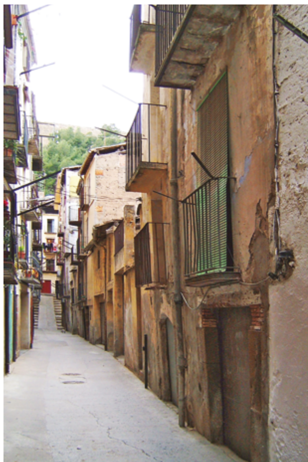
Carrer dels Teixidors de Balaguer al 2003, anomenat antigament "de la Juheria".

És aquest autor el que, en el treball esmentat, ens parla sobre tres processos inquisitorials que es dugueren a terme a la ciutat de Balaguer i a la de Lleida a finals segle XV 2 . La descripció que en fa és prou precisa, com veurem, malgrat que no cita la font primària d'on extreu la informació. L'autor consigna que es desconeixen els crims dels que s'acusava els 66 balaguerins implicats tot i que n'intueix la naturalesa: «[...]La heregía hizo prosélitos en Balaguer, desgraciadamente; ignoramos los delitos de que el santo tribunal acusaba, pero tenemos los nombres de varios vecinos de nuestra ciudad reconciliados unos, condenados otros por la Diócesis de Urgel los años 1490 al de 1493.; tal vez fueran muchos moriscos o judíos. [...]» 3 És aquesta notícia, repetida després pels historiadors que han publicat treballs sobre Balaguer 4 , la que ens ha portat a la present recerca sobre l'aljama balaguerina i la seva desaparició al llarg del segle XV, fins a culminar amb els processos esmentats per Jiménez Catalán.